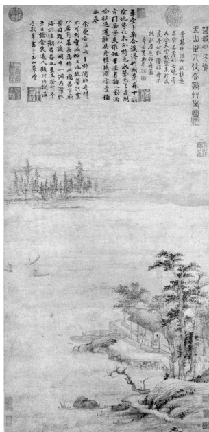
图2 赵元《合溪草堂图轴》纸本,设色,84.3cm×40.8cm

长溪在嘉兴王江泾镇北面十余里的南汇镇。现在已经找不到这条溪流,但还有长溪路、长溪桥供后人怀想。这一带水网密布,在长溪以北十几里处,有一片万余亩的水面叫做汾湖。汾湖古称分湖,是春秋战国时期吴、越两国分界湖,后来又是江、浙两省的分界湖,其水系与附近的太湖、淀山湖、大运河等连通。汾湖之北为苏州,汾湖之南为嘉兴,元末著名文人画家倪瓒就曾隐居汾湖北岸的陆庄。顾瑛《次韵观帖之什》诗中“水如燕尾出湖分,合入长溪直到门”,似乎也可把“湖分”解释为“分湖”,指长溪之水与分湖相通。